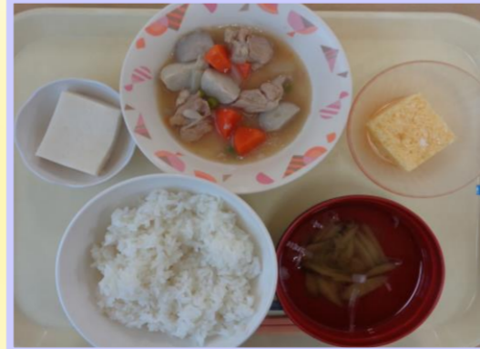
御飯 めった汁 治部煮 べろべろ あいませ