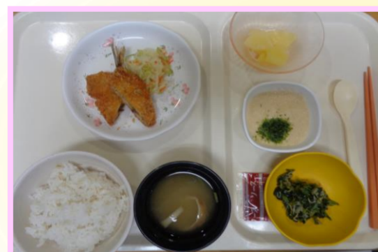
麦とろ アジフライ ほうれん草としらすナムル パイン缶